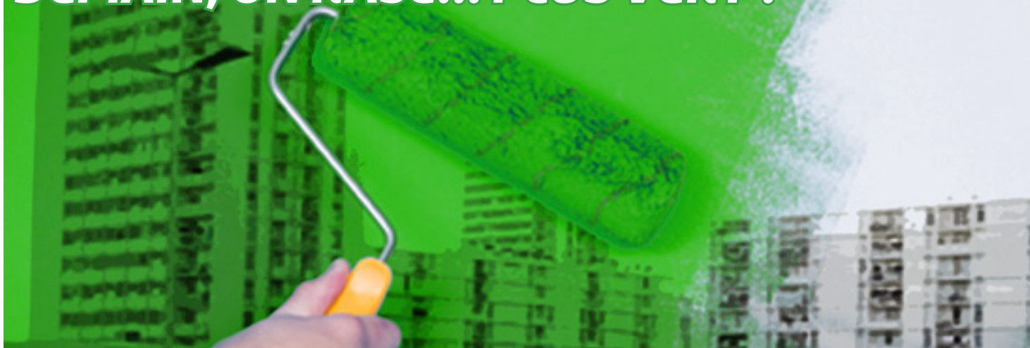
Illustration ICN d'après phoos DR

Donné favori dans certaines grandes villes de l'Hexagone, EELV, malgré son joli score aux européennes en Corse, n'y a pas tablé sur une éventuelle dynamique d'entraînement pour les municipales. Les préoccupations environnementales se sont malgré tout invitées dans les professions de foi de candidats de tous bords.